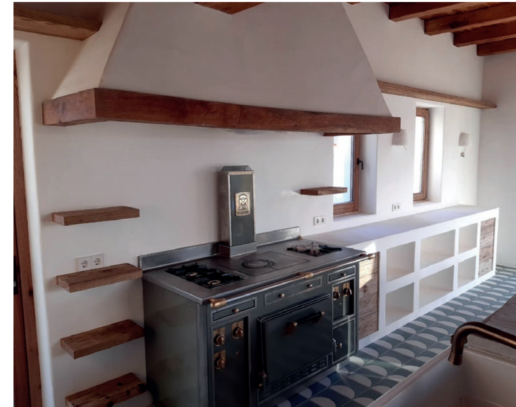
Cocina de autor, realizada a medida con materiales naturales recuperados y tratados